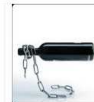
Pa Design Porte-bouteilles