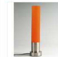
LAMPE A POSER DESIGN